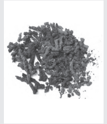
木くずとフンが混じった「フラス」