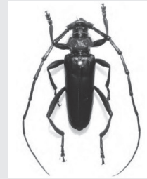
首回りが「赤い色」をしているのが特徴です

中国大陸原産の体長2.5cm～4cm程度の光沢のある黒色のカミキリで、胸部(首部)が赤色になっていることが特徴です。本来、日本には生息しないカミキリですが、最近では埼玉県内各地で確認されています。人への危害はありませんが、幼虫がサクラやウメなどバラ科の樹木につくと、樹幹内を食害し、枯死させます。