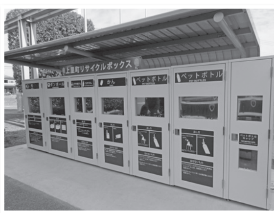
▲上里町リサイクルステーション