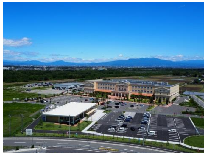
平成29年12月、関越自動車道上里スマートインターチェンジが開通し、発展が期待される上里サービスエリア周辺地区