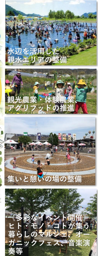
《地区構想のイメージ》