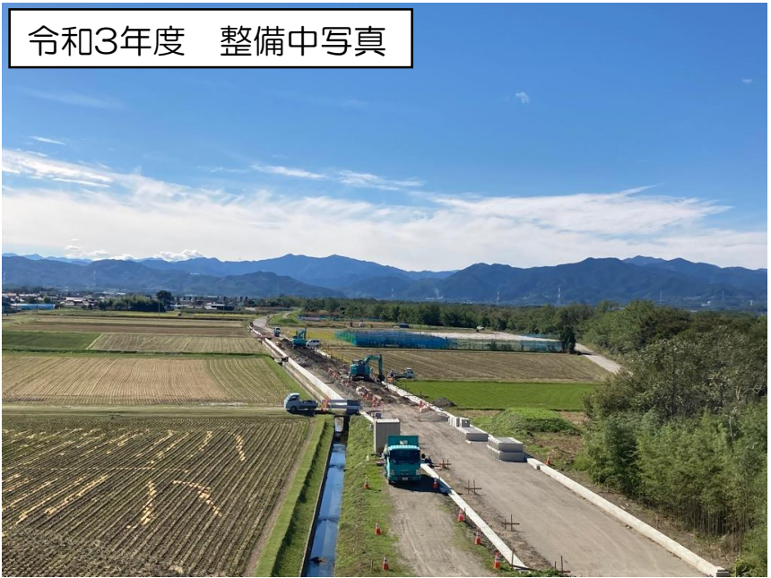
令和3年度 整備中写真