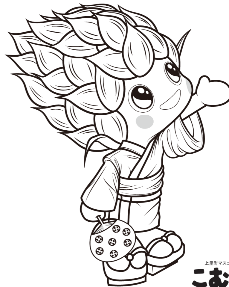
上里町マスコットキャラクター こむぎっち