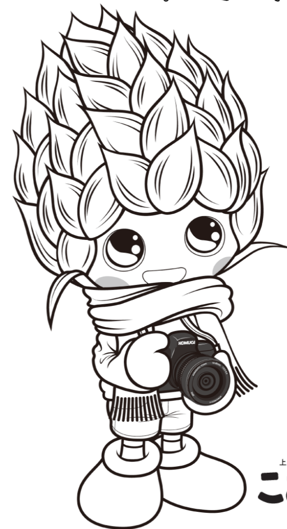
上里町マスコットキャラクター こむぎっち