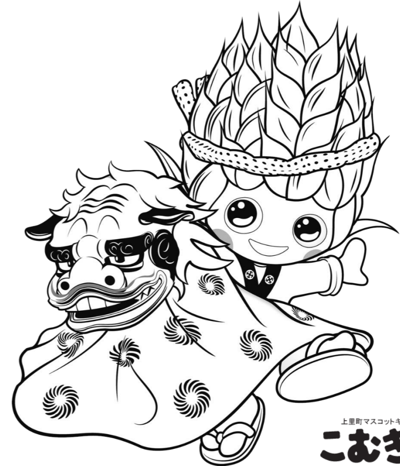
上里町マスコットキャラクター こむぎっち