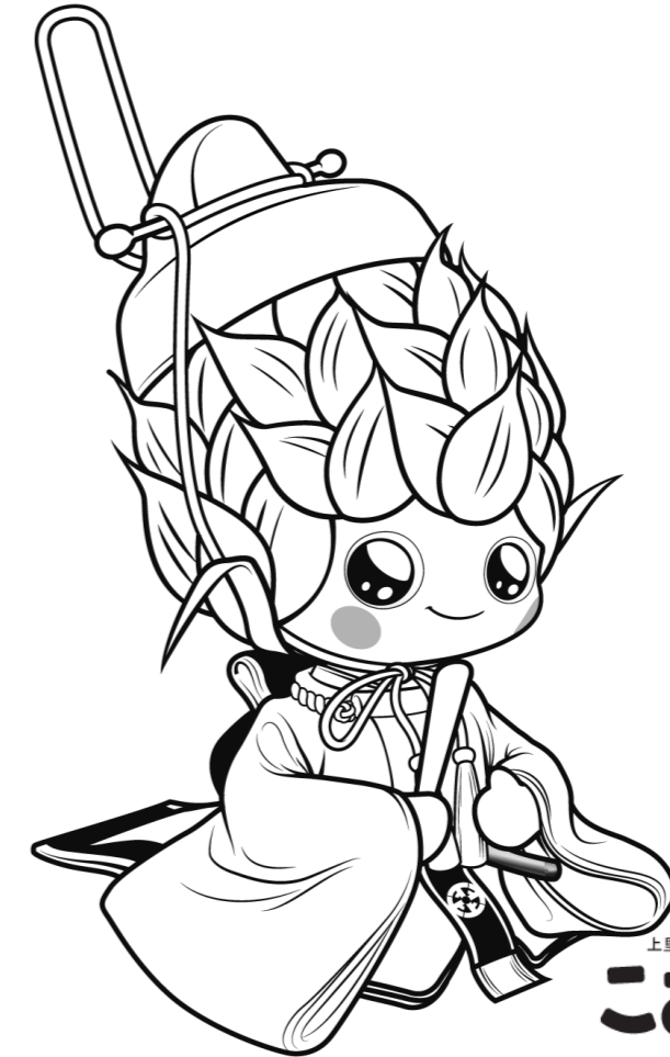
上里町マスコットキャラクター こむぎっち