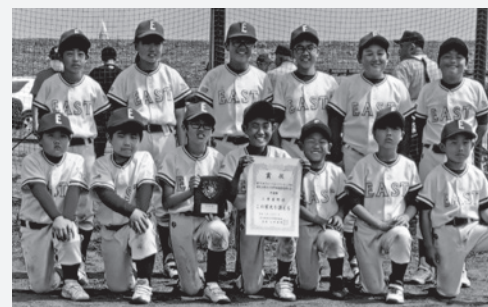
▲上里東野球スポーツ少年団