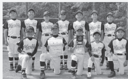
▲上里JBマリーンズスポーツ少年団