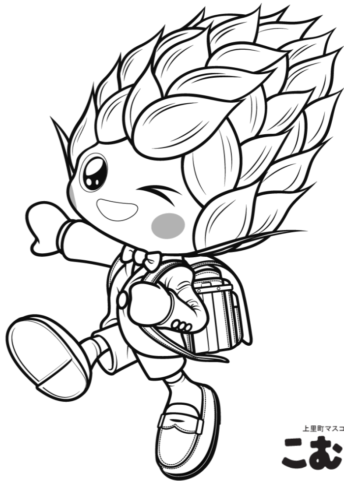
上里町マスコットキャラクター こむぎっち