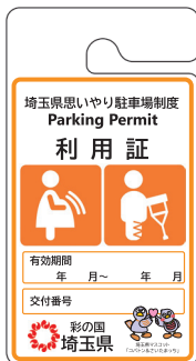
妊産婦、 けが人等用