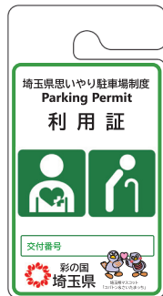
その他の高齢者、 障害者等用