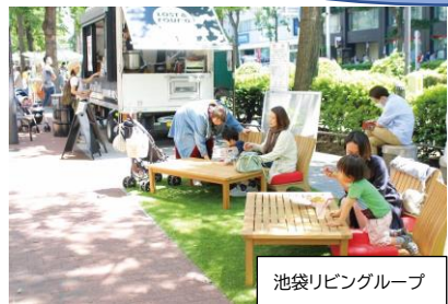
ウォーカブル空間イメージ

※ウォーカブル空間…道路を車中心から“人中心”へ再構築し、沿道と路上の一体的な利用により多様な活動ができる居心地の良い場を創出することで、人々が憩い集うことができ歩きたくなる空間。