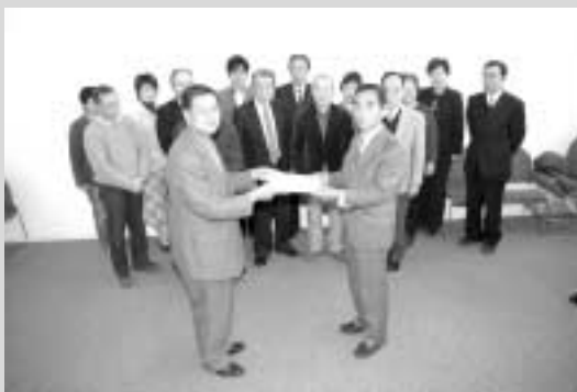
3月に提出された計画答申をもとに、地域包括支援センターが開設・始動されました

今般の重要な改正点の軽度認定者（要支援1・2）の方のケアマネジメントをはじめ、自立と判定された方等の相談に対応する「地域包括支援センター」が役場健康保険課内に開設・始動となりました。