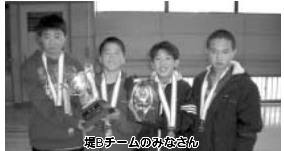
堤Bチームのみなさん