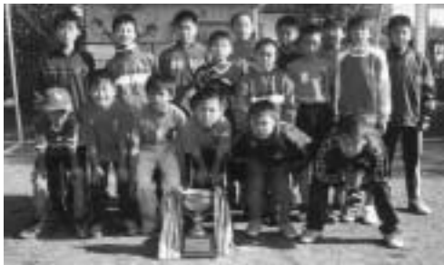
優勝 七本木サッカー