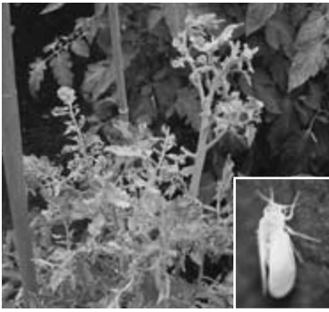
被害株の様子とコナジラミ（右下）