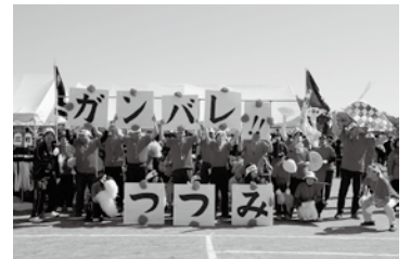
応援賞 優勝 堤