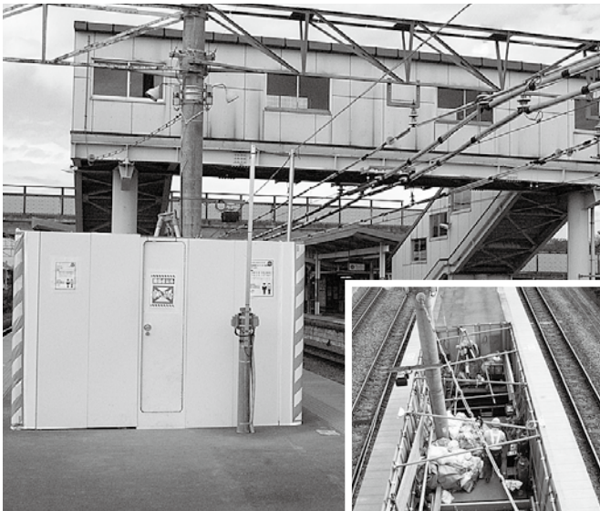
エレベーター設置工事の様子(平成23年3月完成予定)

現在、エレベーターは工事中ですが、このたび多機能トイレが完成し、11月1日(月)から供用開始となりました。