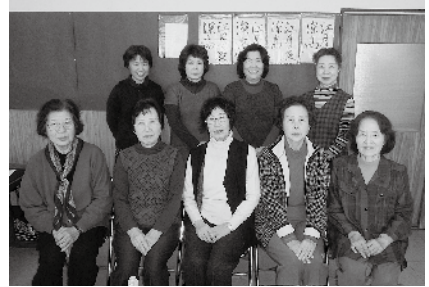
「お気軽に見学にきてください。」

第2、第4水曜日にボールペン字、書道を中心に活動をしています。自分の心・気持ちが字に表現できるように、会員相互の和を大切に、楽しくをモットーに筆を走らせています。公民館まつりに作品を展示したり、埼玉県公募の出品展では、団体で埼玉県知事賞を受賞しました。