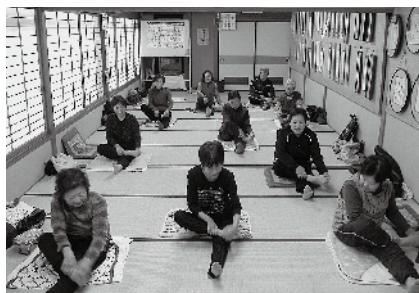
継続は力なり 私達と自彊術で健康な体づくりをしませんか。

自彊術は、身体の関節・筋肉をくまなく動かし、内臓下垂を矯正する健康体操です。また、中国の「按躄導引術」の流れをくむ、文部科学省体育局所管の日本最初の健康体操で、メタボ予防に適した運動です。自彊術をはじめから、関節痛がよくなった・体調がよい等の声が会員からも出ています。現在、毎週金曜日の午前中に活動しています。