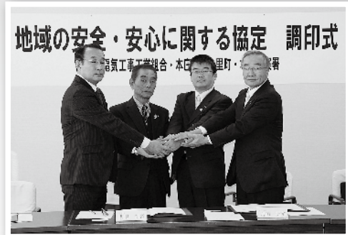
地域の安全・安心に関する協定 調印式

12月20日(木)、埼玉県電気工事工業組合、本庄市、本庄警察署と「地域の安全・安心に関する協定」を締結しました。この協定は、本庄警察署管内の地域住民を犯罪被害から守り、犯罪を防止するとともに、交通安全等の地域安全を推進するため、情報交換等を密に行い、安心・安全のまちづくり実現を目的とするものです。