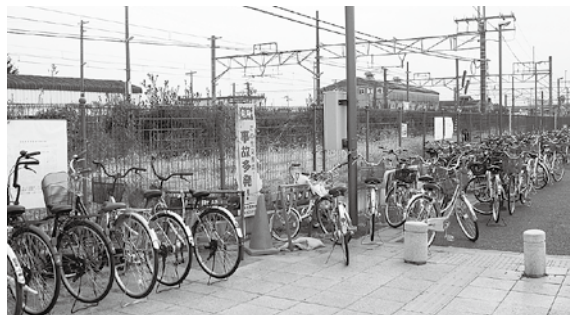
仮設駐輪場付近の様子

また、神保原駅周辺の区域を自転車等放置禁止区域として設定し、放置自転車の整理を行います。