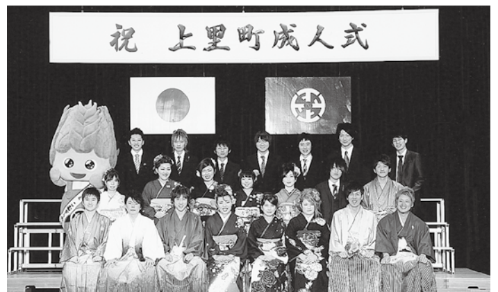
成人式実行委員会の皆さん