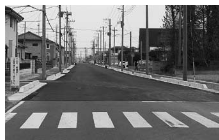
②三田公会堂より西側を撮影