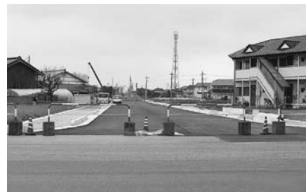
①上里鬼石線交差点より東側を撮影