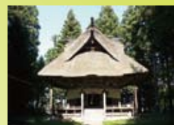
神宮寺 (癒しのパワースポット)