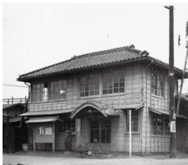
(昭和32年 旧神保原郵便局)

郷土資料館では、「町制施行40周年事業」として上里町に関する写真（風景・建物等）を探していますので、ご協力をお願いします。