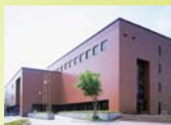
クロス10 (地場産センター)