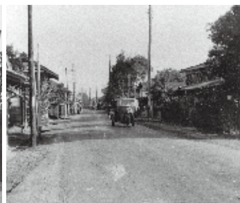
中山道2丁目付近 (昭和26年)

当時は、石神村で、道の両脇には水路が流れ、村には立場(街道で人夫が駕籠などを停めて休息する場所)が設けられ、とっても繁栄していたんだ。