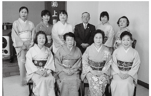
「興味のある方は、見学に来てください。」

昭和42年に「雅友茶道会」という名称で発足し、その後、平成2年に広く諸流の参加を願い「上里町茶道会」の名称に改めました。活動日は第1・2・3土曜日の月3回で、12名の会員で稽古を行っています。