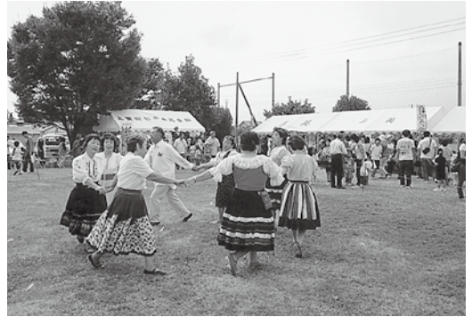
「健康は足下からです。 皆さんの参加をお待ちしています。」