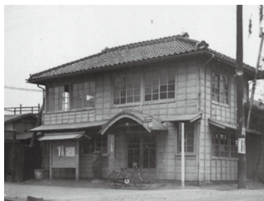
中山道沿いにあった旧郵便局 (昭和32年)

神保原町には、江戸時代の五街道のひとつである「中山道」が通っているんだ。今でも出入り口は、「カギの手」に曲がって街並みが見通せないようになっている、江戸時代の様子をよく残しているんだ。