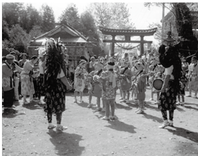
石神社祭礼(昭和46年)

和26年頃に作られた「神保原音頭」が最近になって神保原小学校の運動会などで復活したよ。