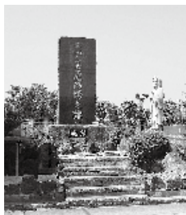
見玉飛行場之跡碑