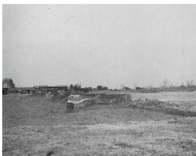
開拓時代の見玉飛行場跡

この飛行場には、95式一型練習機(通称赤トロンボ)や、飛竜・呑竜・隼などの練習機や爆撃機があって、その様子は終戦の日の見玉飛行場を題材とした映画「日本の一番長い日」で知ることができるよ。