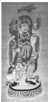
洞仙斎直昌の描いた多門天

大御堂には、江戸時代に洞仙斎直昌という絵師がいたんだ。本名は横山源蔵で、宝蔵寺の十二天図(十二の方向を護る仏)に「絵師、武州賀美郡安保郷大御堂村、横山源蔵洞仙斎直昌敬書之」とあつてそれがわかるんだ。直昌は、本庄市栗崎の宥勝寺の「涅槃図」や、五明村絵図なども描いているんだ。