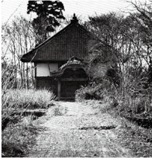
吉祥院旧阿弥陀堂(昭和46年)

また、吉祥院は中世の館跡で、廻りには堀があつて土塁の一部や板碑・五輪塔・宝篋印塔なども残っているんだ。周辺には、昭和58年に発掘調査された阿保境館跡があつて、ここでは石組みされた直径6メートルの井戸が発見されているんだ。