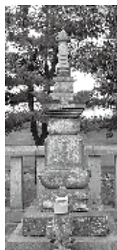
陽雲寺三条夫人之墓