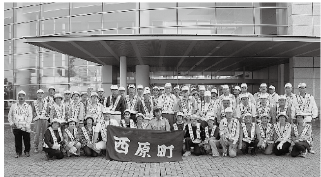
9月30日(月)には、町役場庁舎前で本庄警察署長を招いての激励会が行われました。