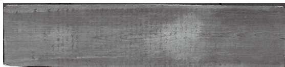
長幡部神社の俳句額

長浜には長幡部神社のほかに、久保・上郷の皇大神社や宮・六所の丹生神社があるんだ。ここは明治41年に長幡部神社に合祀されたんだけど、戦後に社殿が残されていたため氏子の要望によって元に戻されたんだ。