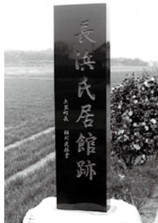
長浜氏居館跡之碑

長浜三郎信光の一族の長浜六郎左衛門は、鎌倉時代末期に新田義貞の家臣として活躍したんだ。その活躍は、「太平記」や「新田正統記」などに書かれているんだ。今はその入口に「長浜氏居館跡之碑」が建っているよ。