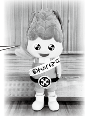
けんこう大使こもぎっち

※人間ドック(予防検診)の補助金申請と特定健診等の両方を利用することはできませんので、どちらか一方の制度をご利用ください。