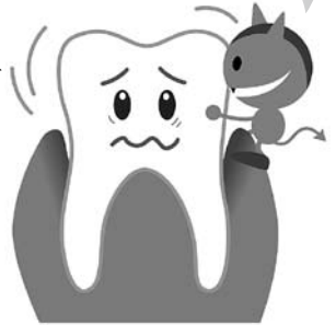
平成26年度歯周疾患検診実施歯科医院一覧