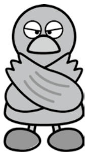
埼玉県マスコット コバトン

10月は不正軽油撲滅強化月間です。不正軽油に関する情報をお待ちの方は、お問い合わせ先までご連絡ください。