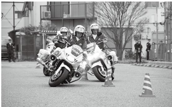
▲11月30日(日)、「年末年始特別警戒出陣式」の様子。防犯、交通安全対策の街頭活動の強化が図られました。