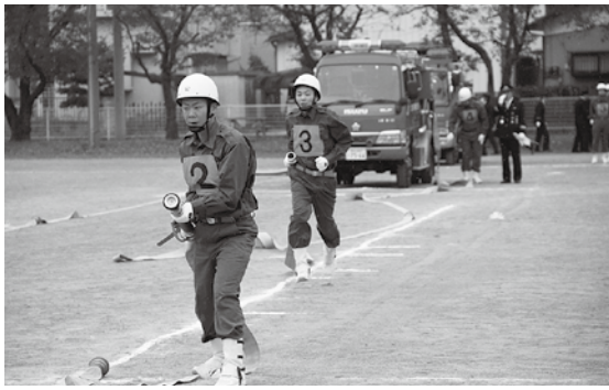
▲11月9日(日)に行われた上里町消防団・署特別点検の様子。有事のときに備えた日ごろの訓練の成果を披露しました。

一人ひとりが防犯を意識し、また、事故にあわないよう交通安全にも留意し、安心・安全なまちをつくりましょう。