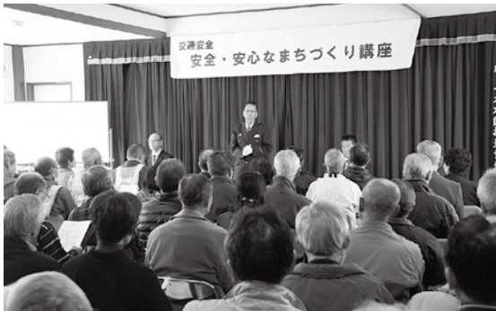
▲11月16日(日)、三田公会堂で行われた上里東小地区合同「防犯のまちづくり出前講座」。講座内容を活かし、防犯パトロール隊のより一層の活躍が期待されます。