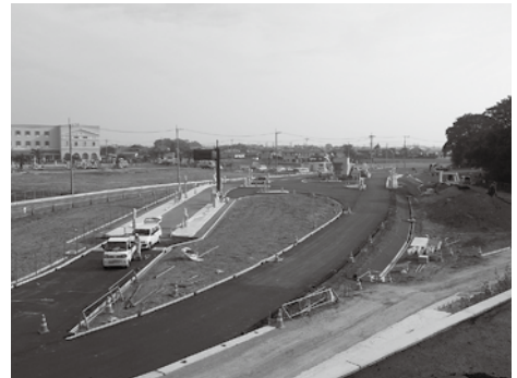
開通に向けて工事が進んでいます