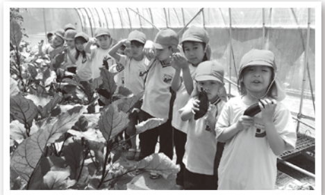
ビニールハウスでトマトとなすの収穫が始まりました。採れたての新鮮野菜をその日の給食に使用しております。