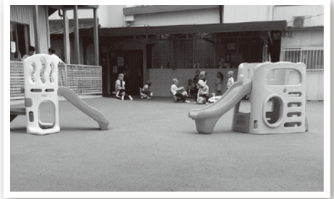
転んでも怪我をしないように園庭全面にゴムチップ舗装を施しております。