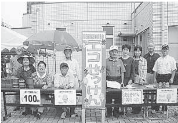
第11回ワープ上里フェスタにて、販売の様子（H26.9.15）