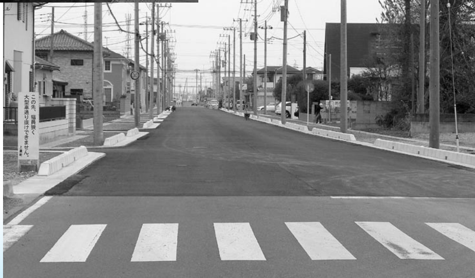
(三田公会堂より西側を望む)

※都市計画道路とは、都市計画法に基づいて都市の骨格となり、まちづくりに大きく関わる道路のことで将来の都市像を踏まえて計画されています。