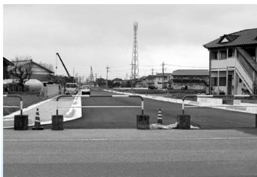
(神保原本郷線、交差点より東側を望む)