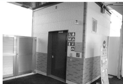
(上り線側の多機能トイレ)

■JR神保原駅改札内のバリアフリー化施設設備のため3月8日(火)よりエレベーターが供用開始されました。