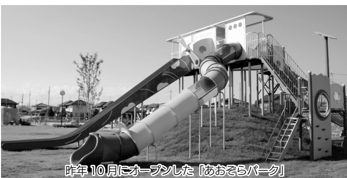
昨年10月にオープンした「あおぞらパーク」

実現できなかった公約の具体的な施策としては、1期目に掲げた、神保原駅の始発電車の実現化、交番の増設があります。4期目においての公約では継続案件として、健康増進センターの建設についてはワーキンググループを立ち上げ検討しており、公立保育園の改築についても庁内検討委員会を開催し、開園に向けて協議をしている。