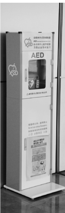
役場庁舎内に設置されているAED

都市基盤の整備では、古新田四ツ谷線の開通、あおぞらパーク。教育の分野では、「まなびとふれあいの町宣言」を推進、上里中学校の改築、小学校の耐震化など。国体も開催され、ふれあいまつり、桜まつりも始まり、タウンプロモーションにはこむぎつちが誕生。今後の町づくりの希望は防災、防犯の観点から安心・安全な町づくりを基盤として、企業誘致やサービスエリア周辺地区の活性化を図り、人口減少に歯止めをかけて、町の持続的発展を望む。