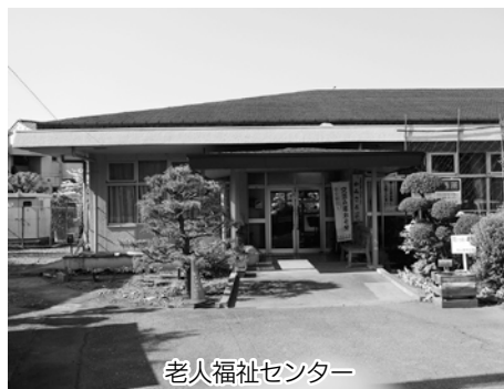
老人福祉センター