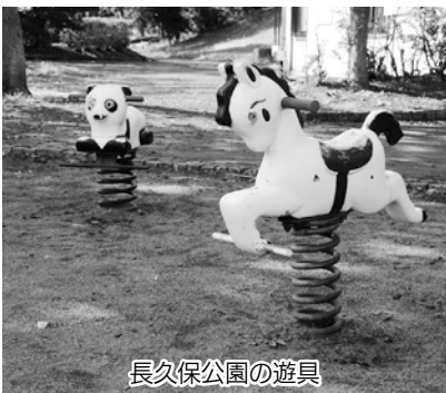
長久保公園の遊具

答 現在、町内には、公園や学校、保育園、児童館を合わせて316基の遊具が設置されています。保育園及び児童館には修繕が必要な遊具はなく、学校遊具についてもわずかな一方、公園遊具につきましても、全127基のうち37基が修繕、15基が撤去の対象となっており、計画的に修繕や撤去を行ってまいります。これらにかかる費用は約800万円程度と見込んでいます。今後、遊具の更新や修繕に関する計画を策定する中で、ふるさと納税制度を初めとしたあらゆる寄附制度活用の調査・研究をしております。