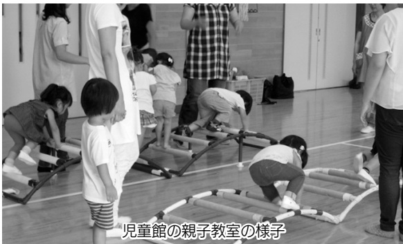
児童館の親子教室の様子

答 現在、各児童館では、子育て支援事業として、親子体操教室、季節の工作など育児教室を実施していますが、事業のない曜日は来館者が少ないので、未就学児の親子が集える場として役割を担えるよう検討中です。