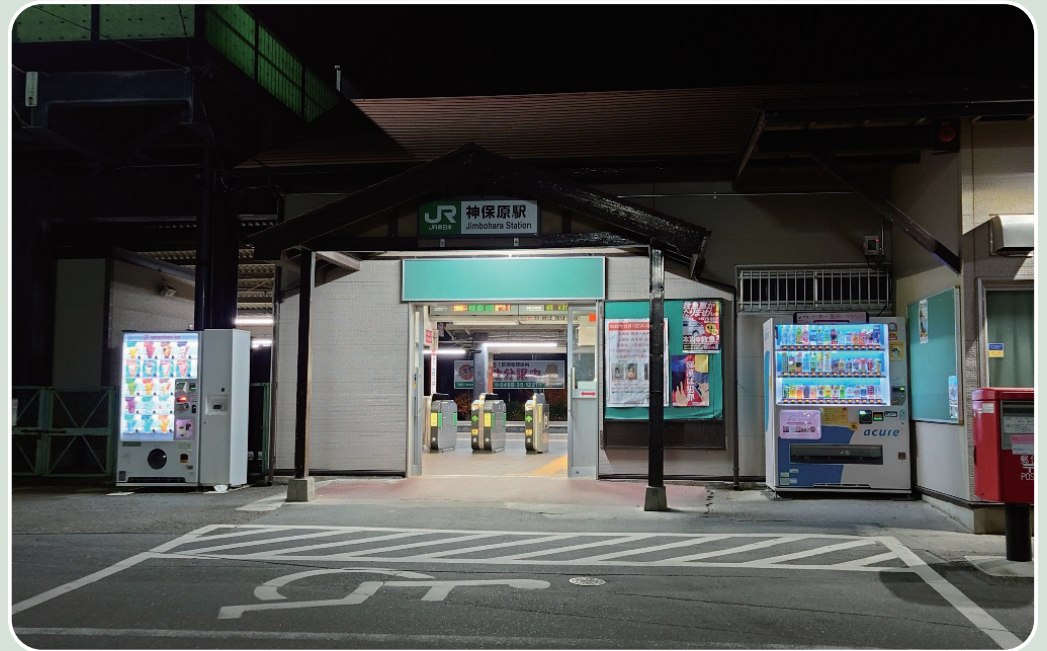
上里フォトコンテスト優秀賞「早朝の神保原駅」応募者：タクトさん

●税金等の納付は便利な口座振替をご利用ください。 税金 金 税務課収税係 ☎35-1220 上・下水道料金等 金 上下水道課 ☎33-4161 介護保険料 金 高齢者いきいき課高齢介護係 ☎35-1243 後期高齢者医療保険料 金 健康保険課医療年金係 ☎35-1222