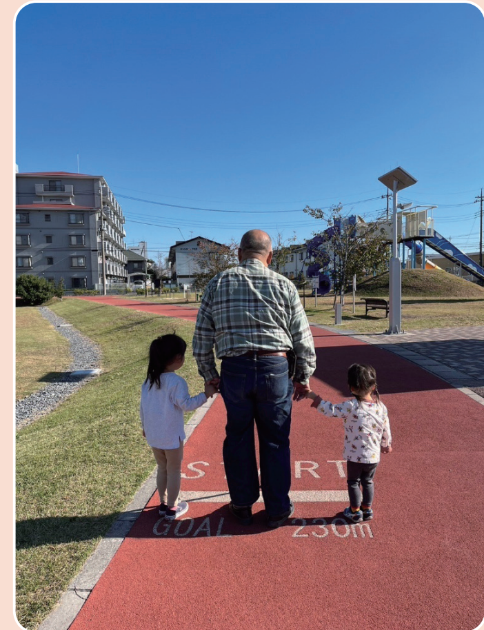
上里フォトコンテスト優秀賞「孫の帰省」 応募者：isaji_61さん

●税金等の納付は便利な口座振替をご利用ください。 税金・税務課収税係 ☎35-1220 上・下水道料金等・上下水道課 ☎33-4161 介護保険料・高齢者いきいき課高齢介護係 ☎35-1243 後期高齢者医療保険料・健康保険課医療年金係 ☎35-1222