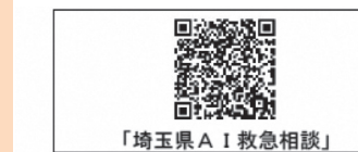
「埼玉県AI救急相談」 🔍 埼玉県AI救急相談 で検索！