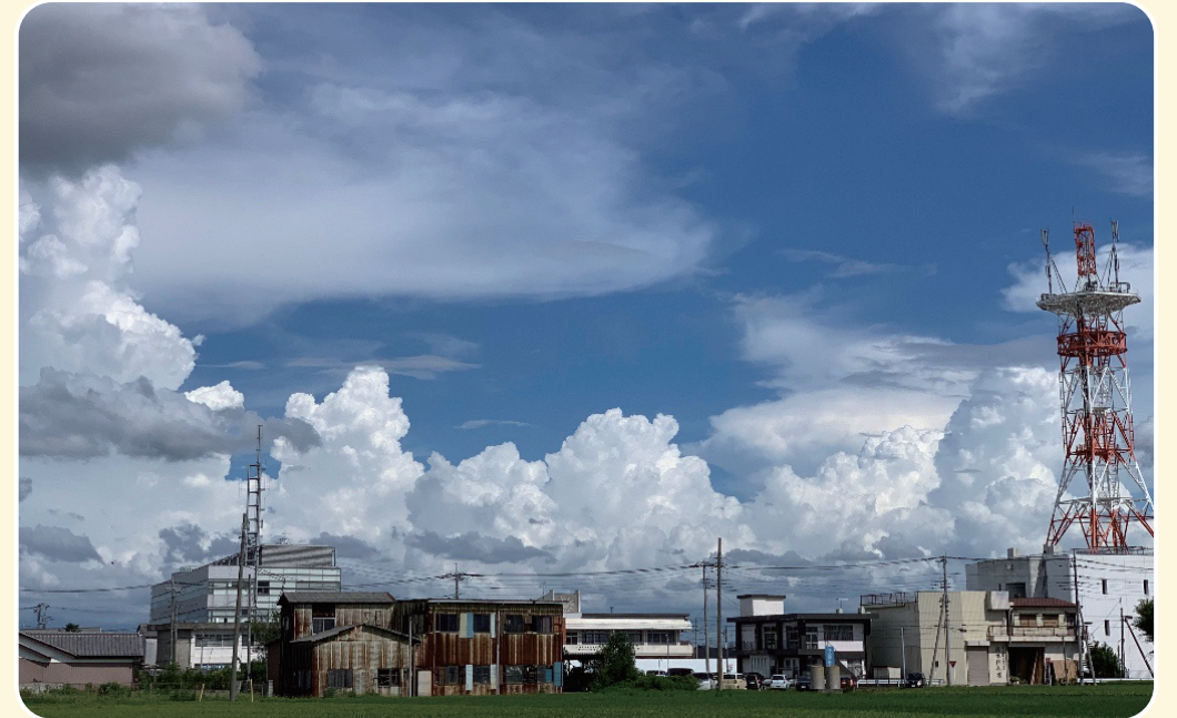
上里フォトコンテスト優秀賞「夏の終わり」応募者：えだまめさん

●税金等の納付は便利な口座振替をご利用ください。 税金...税務課収税係 ☎35-1220 上・下水道料金等、下水道事業受益者負担金... 上下水道課 ☎33-4161 介護保険料...高齢者いきいき課高齢介護係 ☎35-1243 後期高齢者医療保険料...健康保険課医療年金係 ☎35-1222