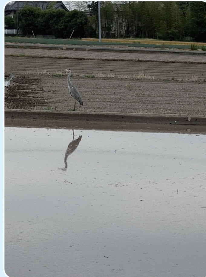
上里フォトコンテスト優秀賞「田植え前の思い出」 応募者：ごろチャームさん

●税金等の納付は便利な口座振替をご利用ください。 税金...税務課収税係 ☎35-1220 上・下水道料金等...上下水道課 ☎33-4161 介護保険料...高齢者いきいき課高齢介護係 ☎35-1243 後期高齢者医療保険料...健康保険課医療年金係 ☎35-1222