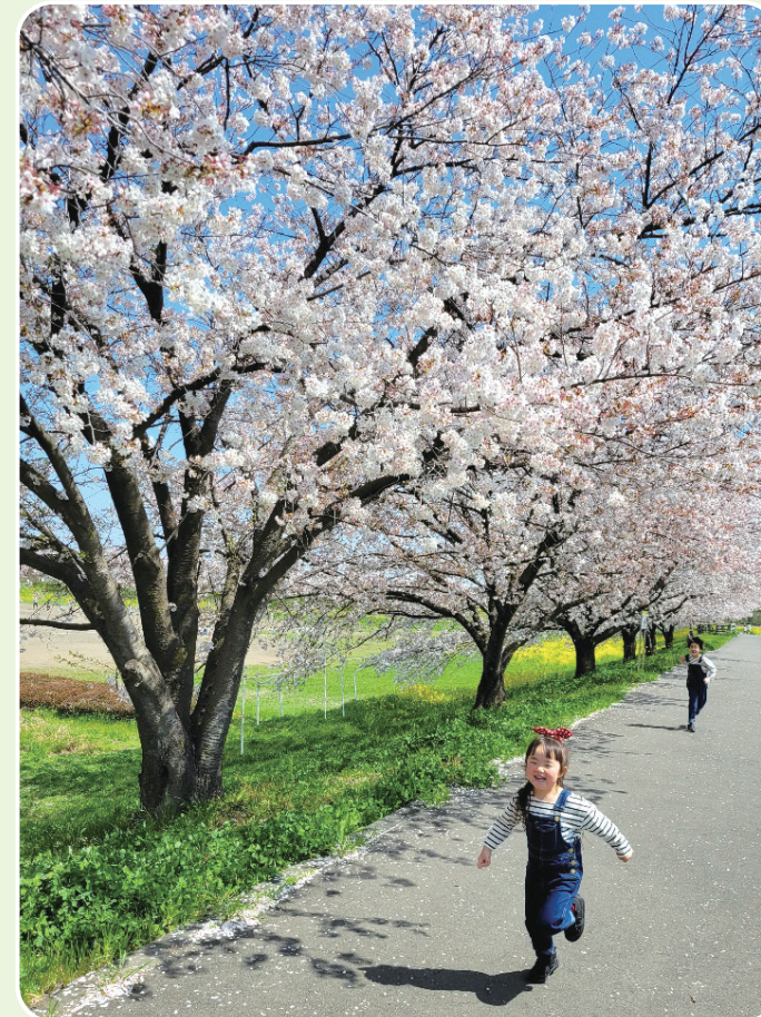
上里フォトコンテスト大賞「桜咲くはる」 応募者：ayaccoさん