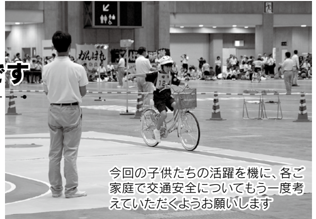
今回の子供たちの活躍を機に、各ご家庭で交通安全についてもう一度考えていただくようお願いします