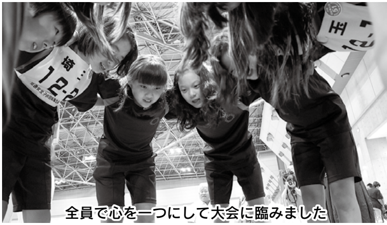
全員で心をつなげて大会に臨みました