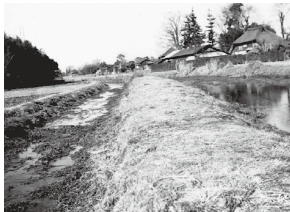
昭和32年ごろの忍保川と北堀

まいりましたが、元和年間(1615～1624年)に村民により現在の場所に移したと伝えられています。