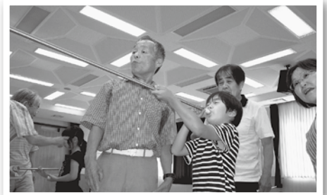
公民館「吹き矢クラブ」の方々による「吹き矢教室」。クラブ生も大勢参加し、世代間交流を行っています。