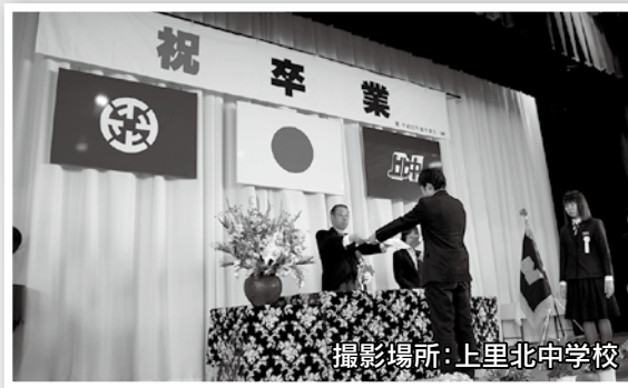
撮影場所・上里北中学校

3月15日(水)に町内各中学校で、23日(木)に町内各小学校で、平成28年度卒業式が行われました。今年度は、小学校335名、中学校352名の児童・生徒の皆さんがそれぞれの学校に別れを告げ、新しい目標に向かっての一步を踏み出しました。卒業生の皆さんが、これから自分の進むべき道を発見し、社会へ大きく羽ばたいていってくれることを期待しています。