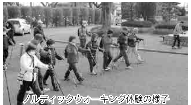
ノルディックウォーキング体験の様子