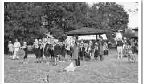
公民館・団寿共同参画推進センターとの合同まつりに自作の御神輿で参加する放課後児童クラブ生たち。こむぎっちょも参加!