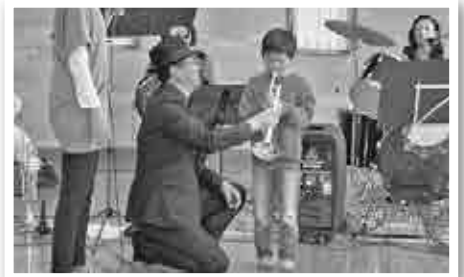
未来のトランペット奏者。 おんがくサークル「かるがも」によるミニコンサートで初めてのトランペットで音がでああ〜!