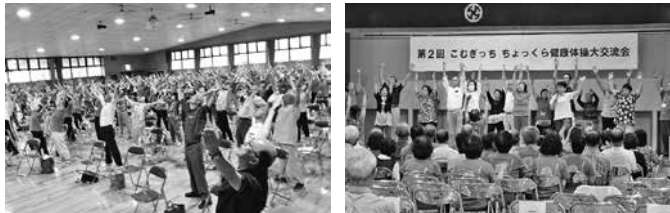
平成29年度の大交流会の様子