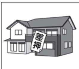
不動産の差押から公売