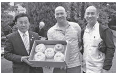
大使公邸にて新高梨を手渡し(左から、町長・南アフリカ共和国商工会議所会頭・(株)味輝の荒木社長)

また、翌日には、大使館関係者から「今後、大使館職員と上里町を訪問したい」とのお礼のメールもいただきました。今後も様々な機会を通じて、上里町のPR活動をしていきたいと思っています。