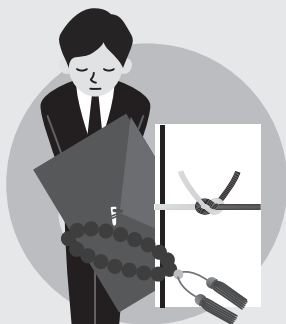
秘書等が代理で出席する場合の葬儀の香典