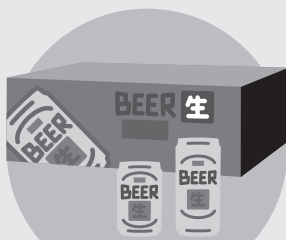
町内会の集会・旅行などの催し物への寸志・飲食物の差し入れ