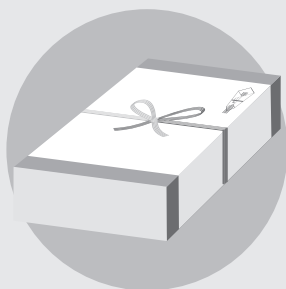
お年賀、お中元、お歳暮