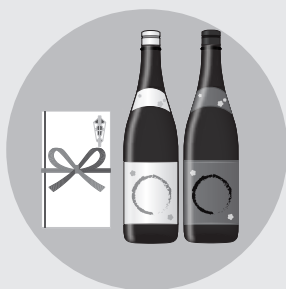
お祭りへの寄附・差し入れ