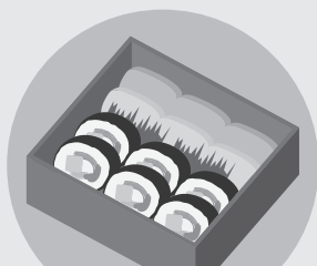
地域の運動会・スポーツ大会への飲食物などの差し入れ