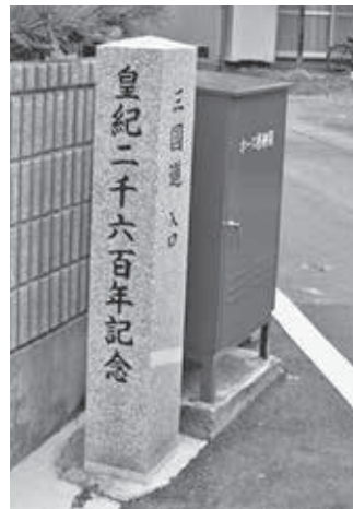
三国道入口とある記念碑