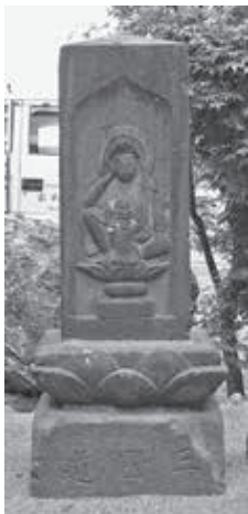
文久3年の如意輪観音