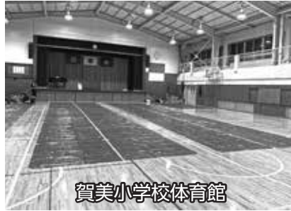
賀美小学校体育館