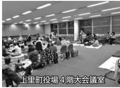
上里町役場4階大会議室