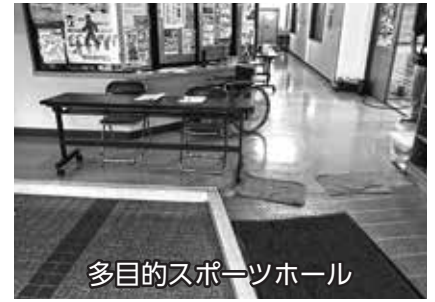
多目的スポーツホール