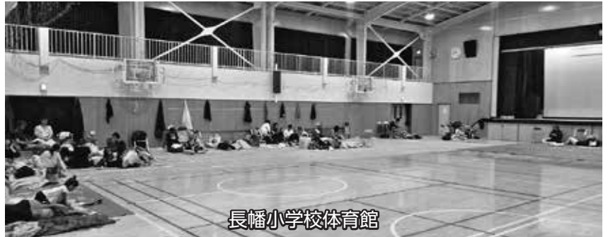
長幡小学校体育館