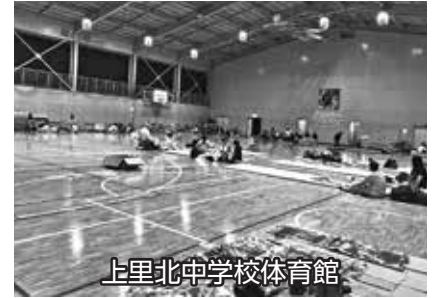
上里北中学校体育館