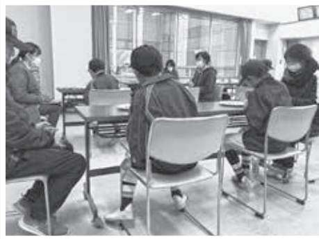
豆つまみ皿うつし

12月21日(土)、町民体育館・多目的スポーツホールで第23回上里町スポーツ少年団交流大会が行われました。全16団体が参加し、「シャトル遠投」や「ぞうきんがけ20メートル走」など5種目で競い合い、交流が図られました。