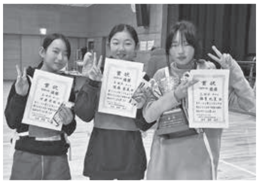
優勝した三田Aチーム