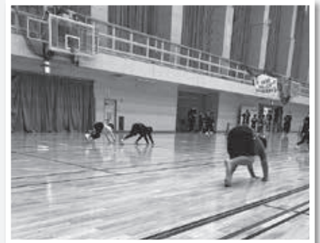
ぞうきんがけ20メートル走