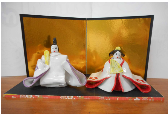
見本は七本木公民館にあります。