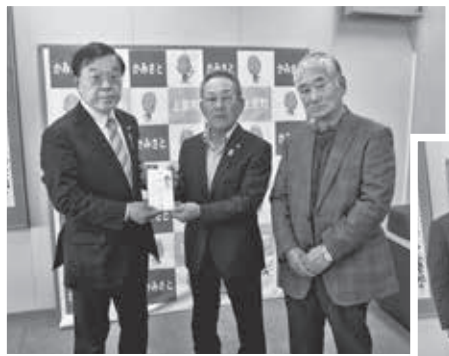
社会福祉協議会に寄附金