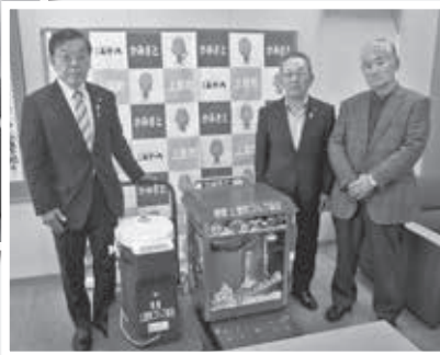
ポップコーン器とかき氷器を寄附

平成30年度上里町チャリティーゴルフ春の大会(4月)・夏の大会(8月)・秋の大会(10月)において、出場された皆様からの善意で頂いたチャリティー金は、総額69,600円となりました。